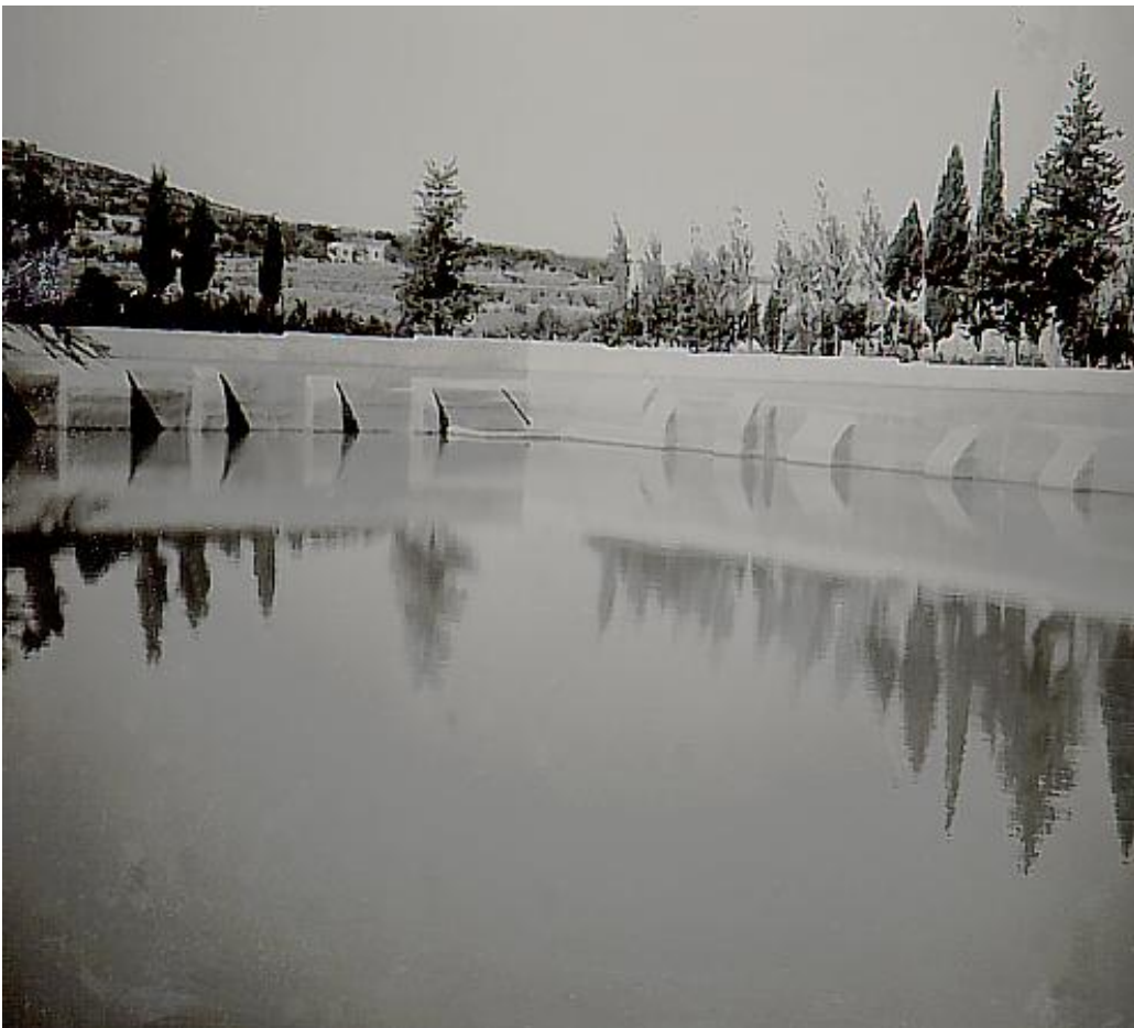
Den större av Salomos bassänger, Bethlehem.

Till sist uppfylldes denna dags digra program med ett besök i Pilatus palats Antonia-borgen. Den är uppförd alldeles intill det gamla templet. Genom den löper en gata som leder till Stefanusporten och fortsätter i Via Dolorosa. Den har varit avsedd att vara en fästning och