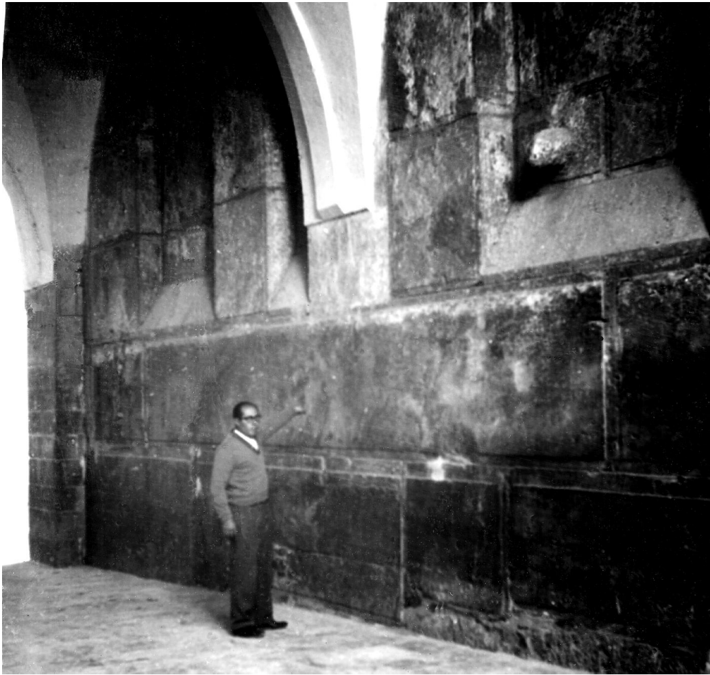
Guiden vid en av de stora stenblocken.