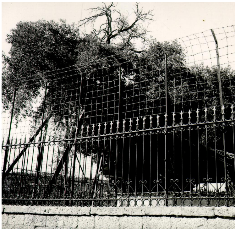
Eken i Mamres Terebintlund

Ej långt från moskén fanns Mamres ek, enligt uppgift 4000-årig och inte en ek utan en slags järnek med mycket små blad. Det var under detta träd som Abraham satt då han fick meddelandet att han skulle få en son, trots att hans hustru Sara var 90 år gammal. Sara stod ju då i tältöppningen och log. Eken är bandad och cementlagad, och är nu innesluten inom ett skyddsgaller.