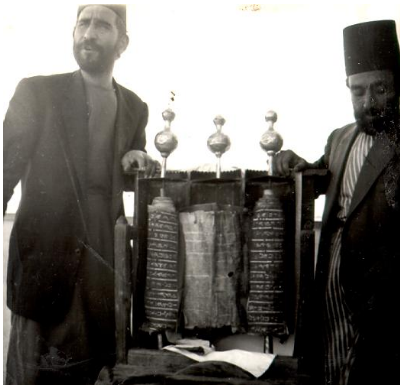
Samariska präster med sin Tora-rulle

I Nablus finns det 250 rena samariter kvar. De är oblandade och gifter sig blott med varandra.