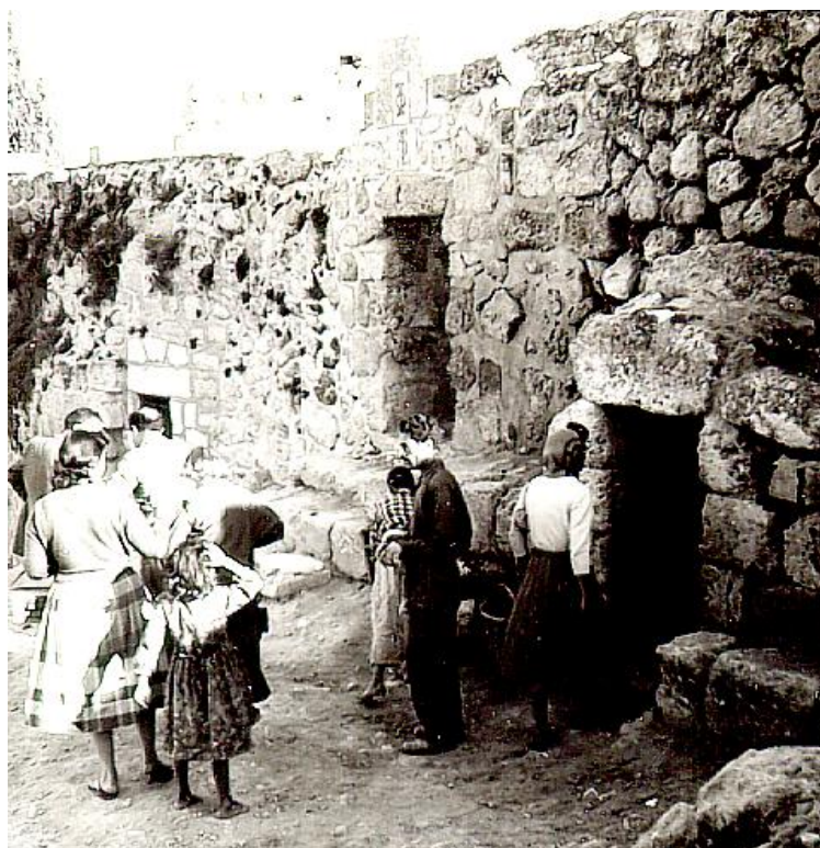
Ann-Hild vid ingången till Lazarus grav.