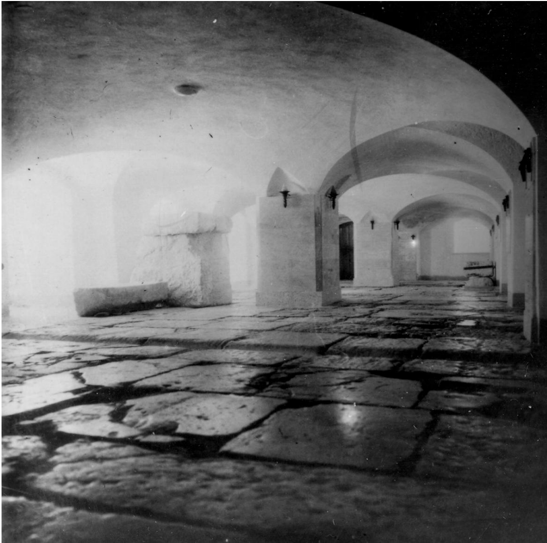
Golvet Lithostroton i borgen Antonia