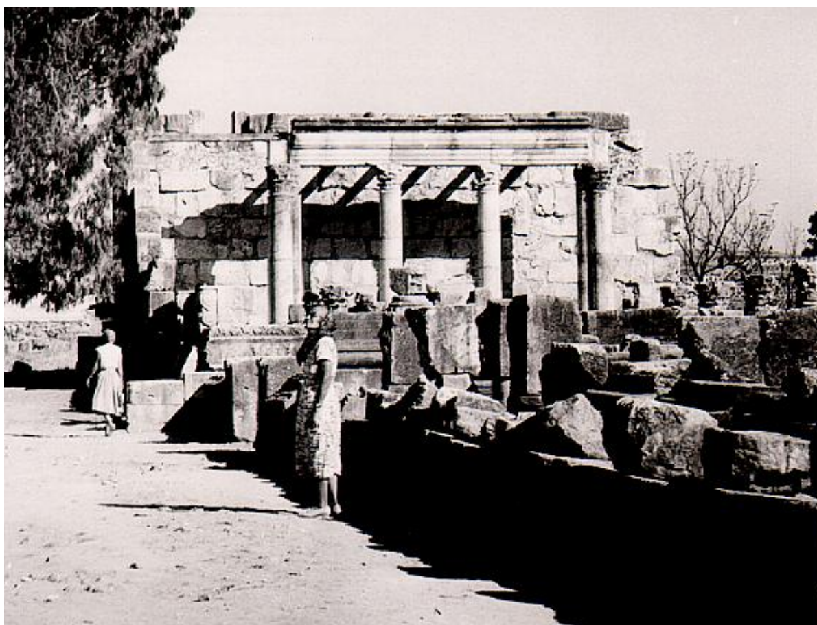
Synagogan i Kapernaum

botade hövitsmannens tjänare samt botade en kvinna från blodgång och andra sjuka och besatta helades. På berget väster om Kapernaum syntes staden Safed. Det var på den Jesus pekade när han i sin bergspredikan sade: ”Icke kan en stad döljas, som ligger på ett berg”. Platsen har ett mycket vackert läge. Sjön med vikar och omgivande höjder hör till det natuskönaste vi sett. Sedan åter till Tiberias där vi vilade och solade och ungdomarna badade. Onsdagen den 4 november åkte vi till Haifa. Fortfarande lika varm dag. Vägen till Nazaret, som går till största delen genom ett slättlandskap, är kantad av flerdubbla rader av eucalyptus. Därutänför vidtagna sedan välansade fält och åkrar. I Haifa fick vi fördriva väntetiden till dess att tullen öppnade klockan halv fyra, då pass och tullformaliteter snart voro överstökade av en ganska gemytlig personal. Så kunde vi gå ombord på Enotria. Trevlig och vänlig besättning. Båten lastade massor av bananer och ägg, otroliga mängder, och sedan allt var klart framåt halv elva på kvällen togs Lennarts bil ombord. Efter ypperlig middag i förfinad miljö gick vi till stängs. Vi är nästan de enda 1a klass passagerarna. Har båda en stor hytt med badrum och toalettrum. Hytter är i storlek som en ordinär svensk sängkammare. Båten rullade något men vi hade tagit våra Amosytpiller mot sådana sjöjukealstrande rörelser.